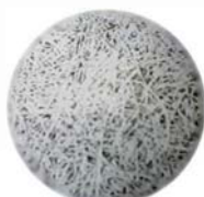
マイクロスコوپ画像